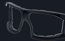
Codice prodotto: SF400FI Inserito in schiuma