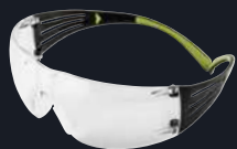
Codice prodotto: SF401AS/AF Lenti: Trasparenti Montatura: Nero/Verde Rivestimento: Anti-graffio/ Anti-appannamento