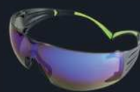
Codice prodotto: SF408AS Lenti: Blu Specchiato Montatura: Nero/Verde Rivestimento: Anti-graffio