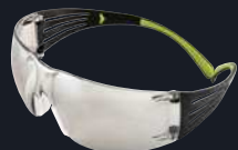
Codice prodotto: SF410AS Lenti: Specchiate per interno/esterno Montatura: Nero/Verde Rivestimento: Anti-graffio