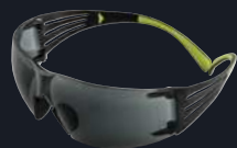
Codice prodotto: SF402AS/AF Lenti: Grigio Montatura: Nero/Verde Rivestimento: Anti-graffio/ Anti-appannamento