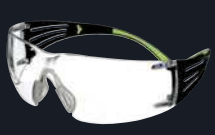
Codice prodotto: SF415AS/AF Lenti: Trasparenti graduate +1,5 Montatura: Nero/Verde Rivestimento: Anti-graffio/ Anti-appannamento