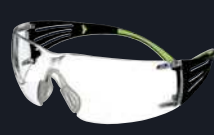
Codice prodotto: SF420AS/AF Lenti: Trasparenti graduate +2,0 Montatura: Nero/Verde Rivestimento: Anti-graffio/ Anti-appannamento