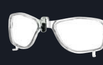
Codice prodotto: RX-SF400 RX Inserito per lenti da vista