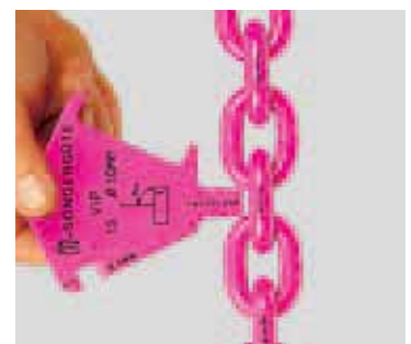
Controllo allungamento della dimensione nominale del passo per usura