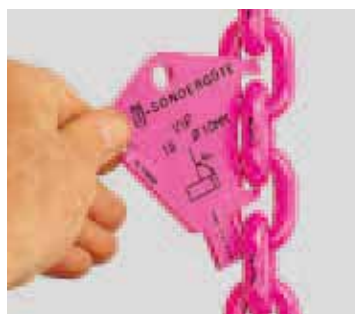
Controllo allungamento per sovraccarico