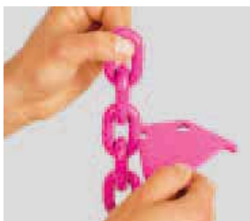
Controllo usura sezione Ø del diametro